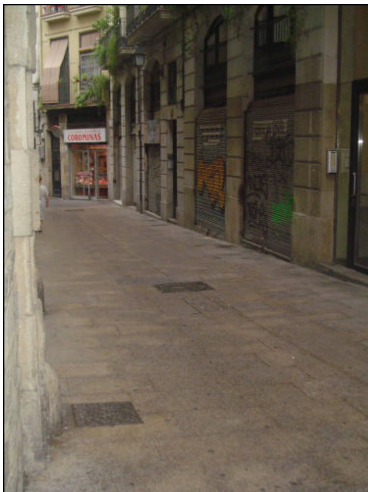
Foto 2: Vista general del carrer Regomir abans de començar els treballs constructius.