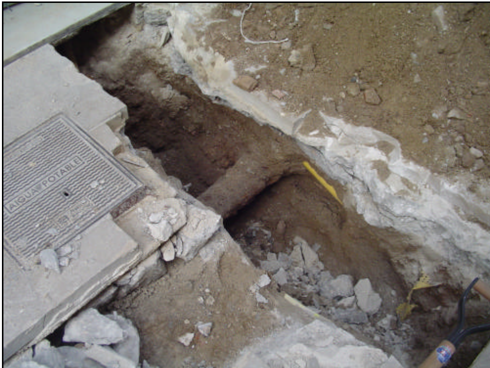
Foto 4: Rebaix efectuat al carrer Regomir tocant a la plaça del Regomir.